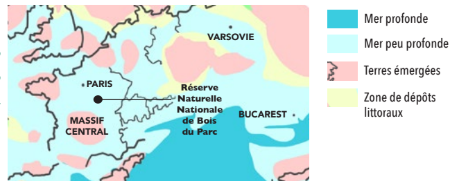
Modifié d'après géologie.mnhn.fr

Les affleurements de la vallée de l'Yonne et particulièrement ceux des carrières de la réserve, permettent de retracer les étapes de construction de ce récif corallien ainsi que de comprendre l'agencement de ces différentes parties les unes par rapport aux autres. Ils permettent ainsi d'observer de nombreuses colonies de coraux fossilisés en position de vie .