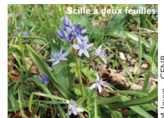
Scille à deux feuilles

Les sous-bois se parent dès le début du printemps du bleu-violet du Scille à deux feuilles avant même que les feuilles des arbres n'apparaissent.