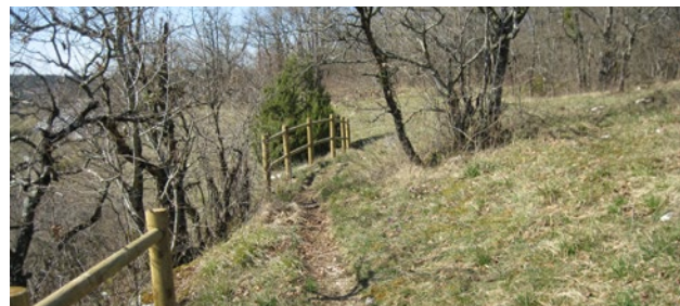
B. Fritsch - CENB

Le sentier présente quelques passages à fort dénivelé rendant l'accès impossible pour les personnes à mobilité réduite. Par ailleurs, en raison de sa localisation le long des falaises, il est vivement conseillé de bien suivre le balisage.