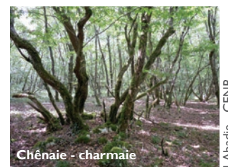
Chênaie - charmaie

Le reste de la réserve, recouvert de forêts , offre une ambiance plus ombragée.