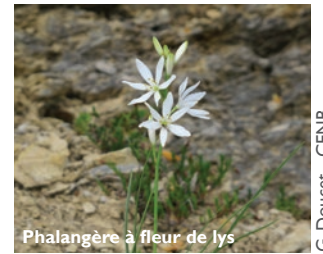
Phalangère à fleur de lys