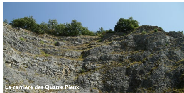
La carrière des Quatre Pieux

Localisation : Parking et carrière des Quatre Pieux