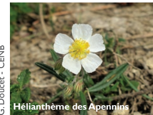
Hélianthème des Apennins