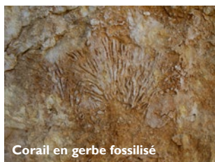
Corail en gerbe fossilisé