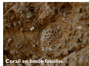
Corail en boule fossilisé

Les affleurements de la vallée de l'Yonne et particulièrement ceux des carrières de la réserve, permettent de retracer les étapes de construction de ce récif corallien ainsi que de comprendre l'agencement de ces différentes parties les unes par rapport aux autres. Ils permettent ainsi d'observer de nombreuses colonies de coraux fossilisés en position de vie .