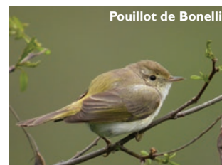
Pouillot de Bonelli

Certains passereaux comme le Pouillot de Bonelli affectionnent tout particulièrement les coteaux secs et bien ensoleillés de la réserve.