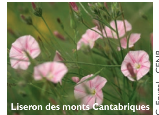
Liseron des monts Cantabriques