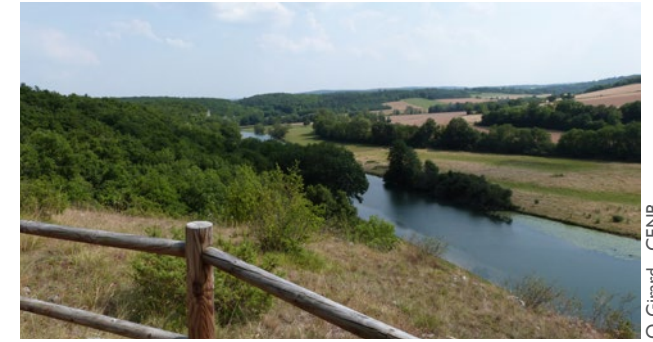
O. Girard - CENB

Dès le XIX e siècle, le lieu - dit « Bois du Parc » attire différents naturalistes qui attestent sa richesse biologique tant au niveau de la flore que de la faune. Puis, le patrimoine géologique de la vallée de l'Yonne commence à susciter l'attention. De nombreuses années de recherche finissent par élever son intérêt au rang national. Le 30 août 1979, afin de contrecarrer un projet d'extension de la carrière du Bois du Parc creusée pour les besoins de l'autoroute A6, le décret de création de la réserve naturelle nationale éponyme est signé.