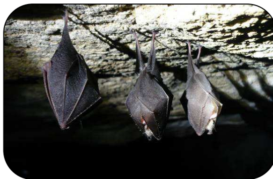
Petit Rhinolophe Rhinolophus hipposideros

Pour atteindre ces objectifs, 17 mesures ont été identifiées dans le DOCOB.