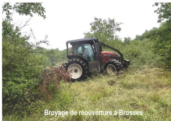
Broyage de réouverture à Brosse