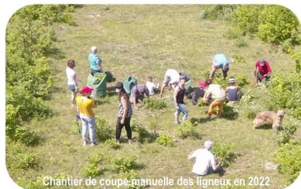
Chantier de coupe manuelle des ligneux en 2022