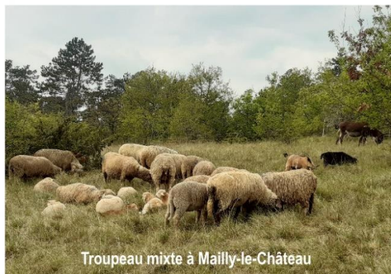
Troupeau mixte à Mailly-le-Château

En parallèle au pâturage, à Brosse, sur une zone très embroussaillée et pour le moment inaccessible au troupeau, un broyage des ligneux aura lieu tous les ans pendant 5 ans.